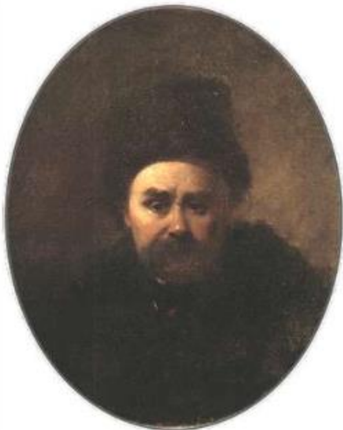
Найвідоміші автопортрети Тараса Шевченка