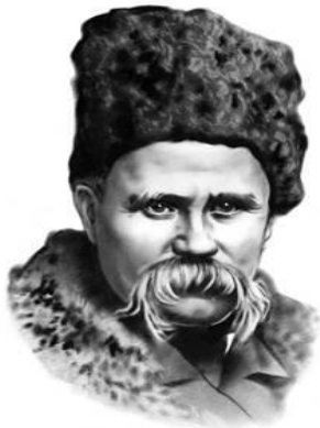
Тарас Шевченко (1814—1861)