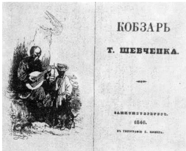
Кобзар – виданий 1840 р.

В 1840-ому році вийшов друком перший Кобзар - збірка його віршів. Московські критики неприхильно поставились до Кобзаря , але в Україні Кобзар викликав велике захоплення.