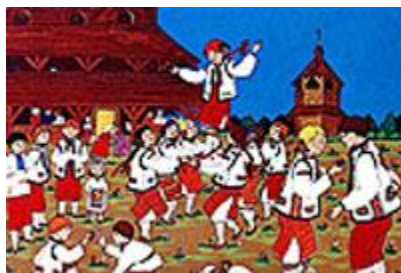
молодь виконує гагілки на Великдень