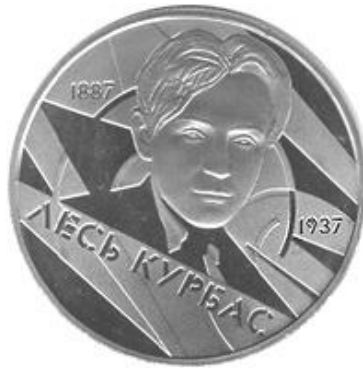
монета (coin) на якій зображений Лесь Курбас