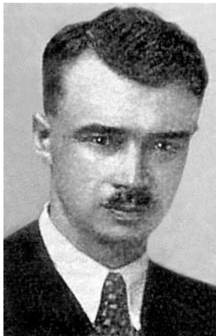
Олег Ольжич (Бабин Яр)