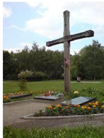
хрест на могилі Олени Теліги в Києві