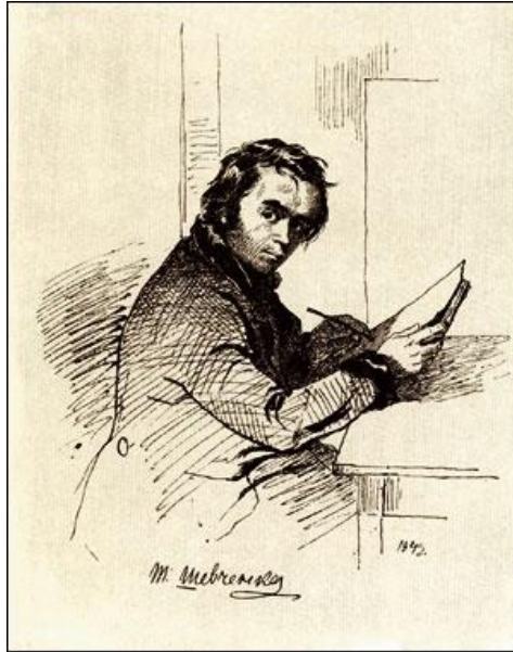
Self-portrait. Indian ink, 1843.

Коли б не Він, то й люди б нас не знали, Коли б не Він, про нас не чув би світ.