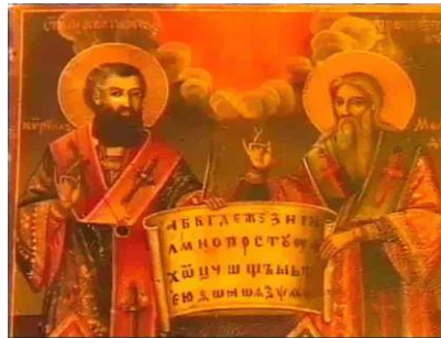
св. Кирило і Methodій

Св. Кирило і Methodій - це були два брати. Вони були слов'янські апостоли (apostles), які жили в 9-ому столітті і проповідували християнську віру між слов'янами. Вони знали, що слов'яни не розуміли ні грецьку, ні латинську мову, тому видумали азбуку для слов'ян, а церковні книги переложили на слов'янську мову. Цю азбуку називаємо кирилиця від імени Кирило.