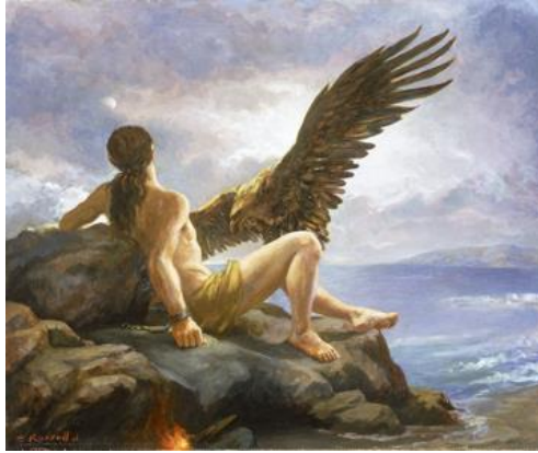
Прометей прикутий до кавказьких гір

В цій поемі Шевченко прославляє кавказькі народи, які довгі роки провадили